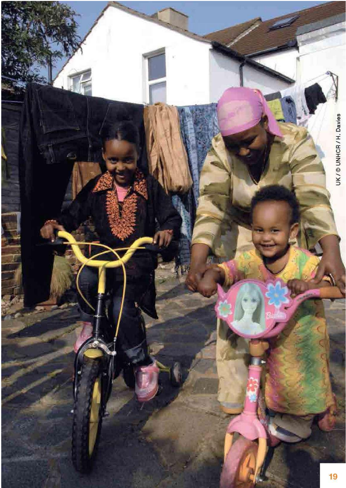
UK / © UNHCR / H. Davies