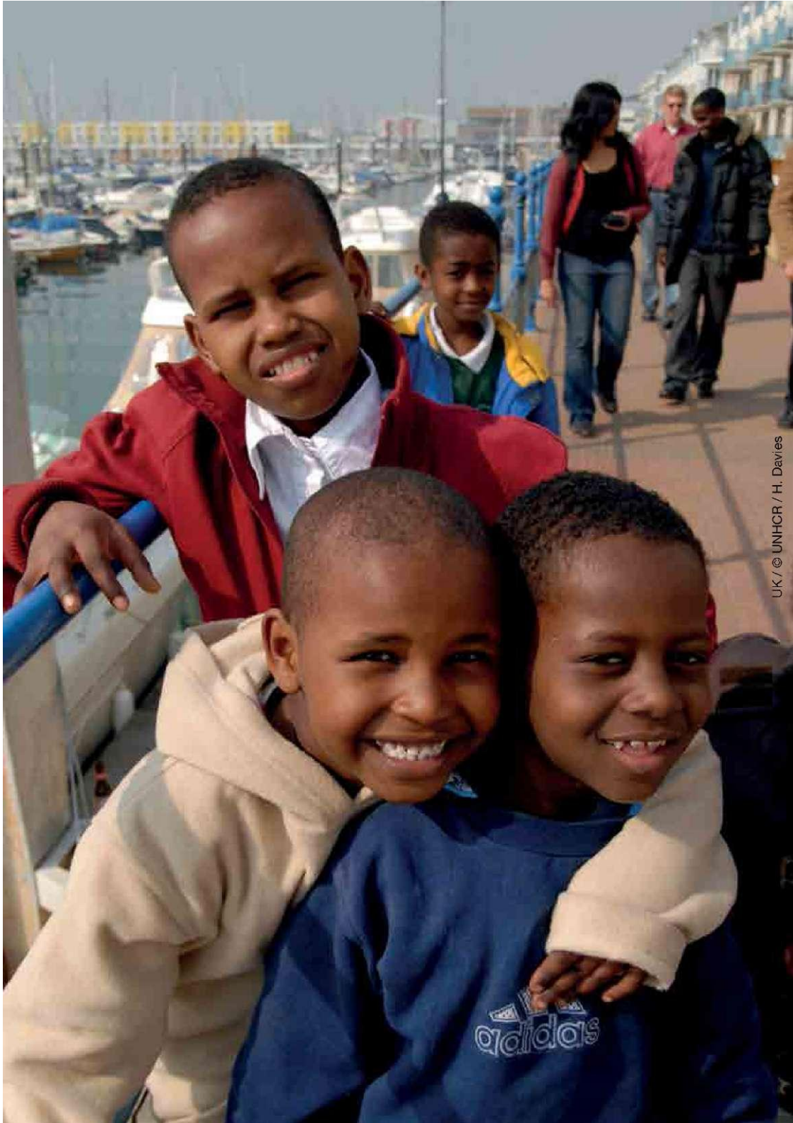
UK / © UNHCR / H. Davies