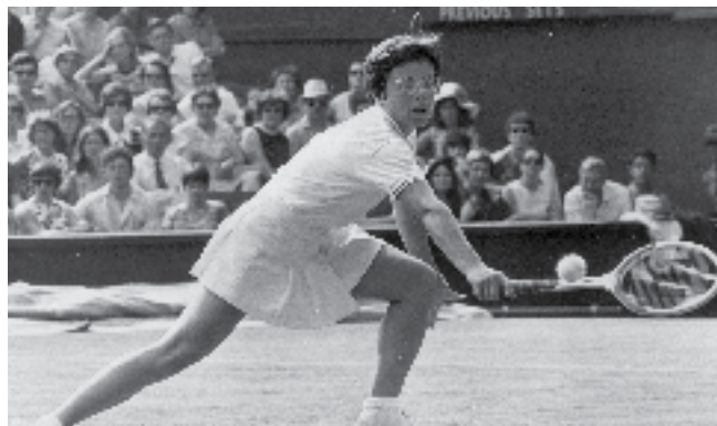
Billie Jean King, championne de tennis et militante pour l'égalité des sexes.