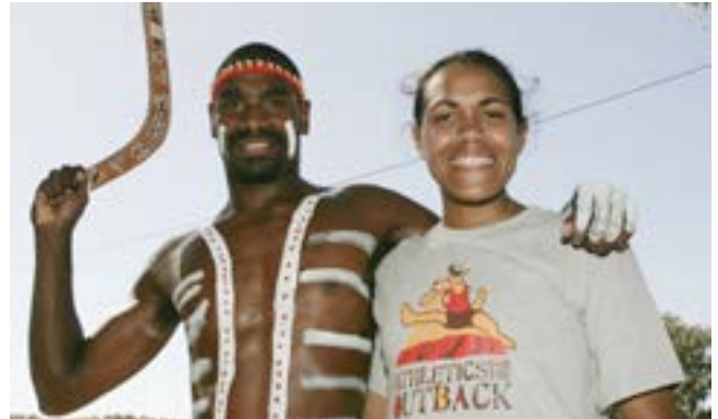
Cathy Freeman, première médaillée d'or d'origine aborigène.