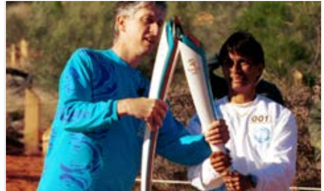
Relais de la flamme entre sportifs de deux générations différentes.