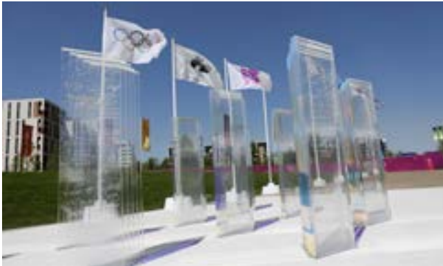
Le mur de la Trêve au Village olympique des JO de Londres.

Vitrine privilégiée des affrontements pacifiques entre nations par les compétitions sportives, les Jeux Olympiques ont une valeur symbolique très importante et ont été associés, dès le début, à la promotion de la paix.