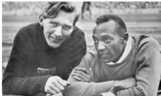
Luz Long et Jesse Owens à Berlin.