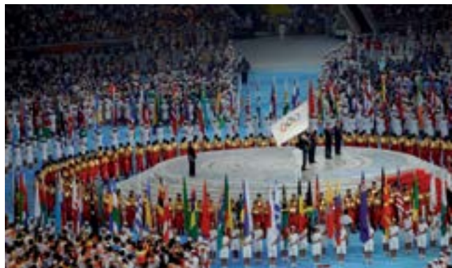
Le drapeau olympique flotte au centre des 205 drapeaux nationaux.