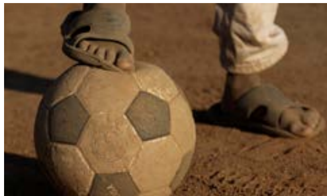
Le CIO s'engage dans des projets d'aide au développement par le sport.