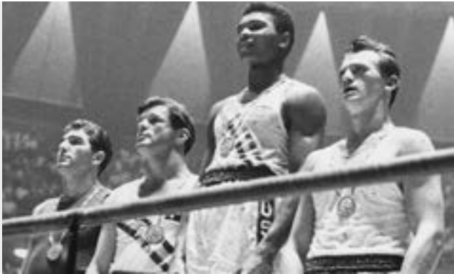
Mohamed Ali sur le podium aux Jeux Olympiques de Rome en 1960.

Les Jeux Olympiques font partie de l'histoire. Ce qui se passe est retransmis dans le monde entier. Il va donc de soi que des faits et des gestes remarquables marquent toute une époque. Voici quelques exemples d'histoires d'athlètes qui ont contribué à faire avancer une cause sociale ou politique.