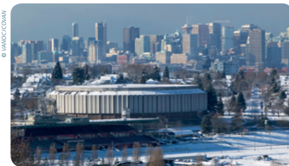
The Pacific Coliseum, Vancouver

Les Jeux Olympiques d'hiver à Vancouver en 2010 représentent une étape importante pour un grand nombre de CNO qui n'ont pas ménagé leurs efforts afin de soutenir leurs athlètes et leur permettre d'arriver à la compétition reine dans les meilleures conditions.