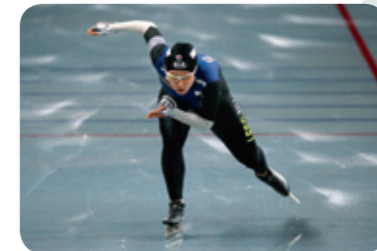
Sang Hwa Lee (Republic of Korea) Speed Skating