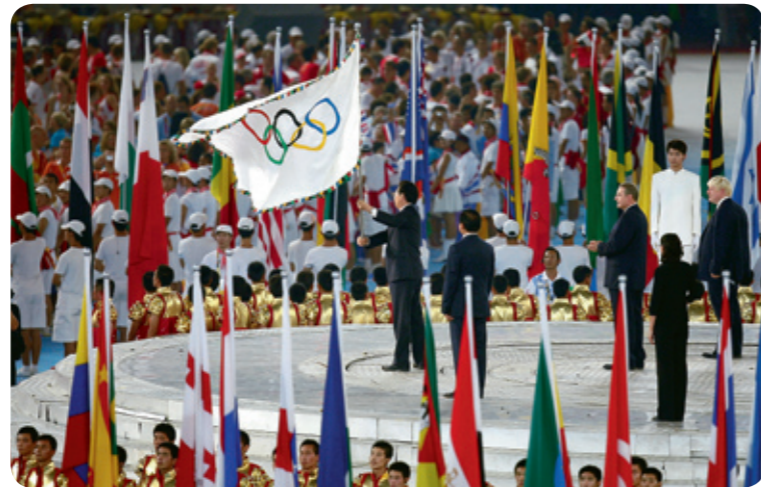
Closing Ceremony of the Games of XXIX Olympiad in Beijing

The Olympic Winter Games in Vancouver in 2010 represent an important step for the many NOCs that have spared no effort in order to support their athletes enabling them to reach this key competition in the best conditions.