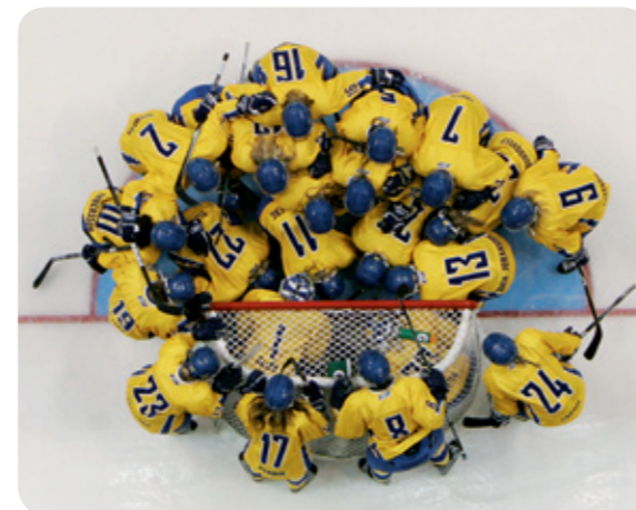
Women's Team of Sweden during the Hockey Canada Cup