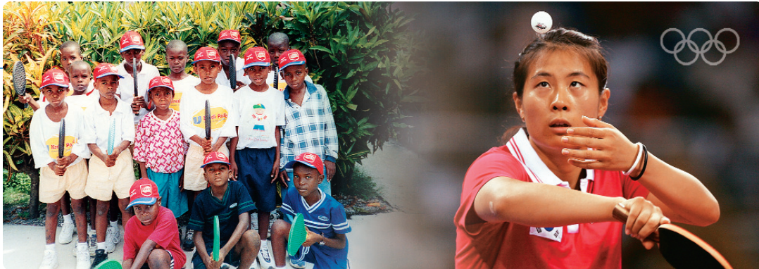
Identifying talented young athletes in Haiti – Kyung Ah Kim, Korea, table tennis bronze medallist in Athens.

Les bénéficiaires sont prioritairement les athlètes à qui sont attribués des bourses, les entraîneurs et les dirigeants sportifs qui reçoivent des cours et des stages de formation. La Solidarité Olympique aide aussi les CNO qui désirent dynamiser leur organisation et moderniser leur gestion.