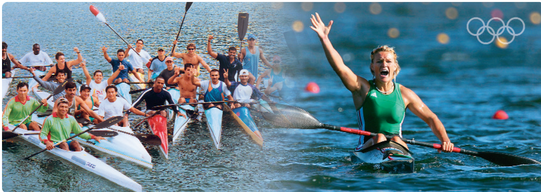
Training camp in Spain – Natasa Janics, Hungary, gold medallist in the K1 500m in Athens.

Les CNO s'impliquent dans divers domaines tels que: éducation, diversités culturelles, développement durable, respect des principes éthiques fondamentaux, valorisation de l'effort et de l'exemple sportif.