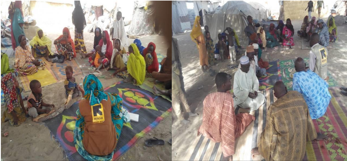
Séances de sensibilisation à Mainé.