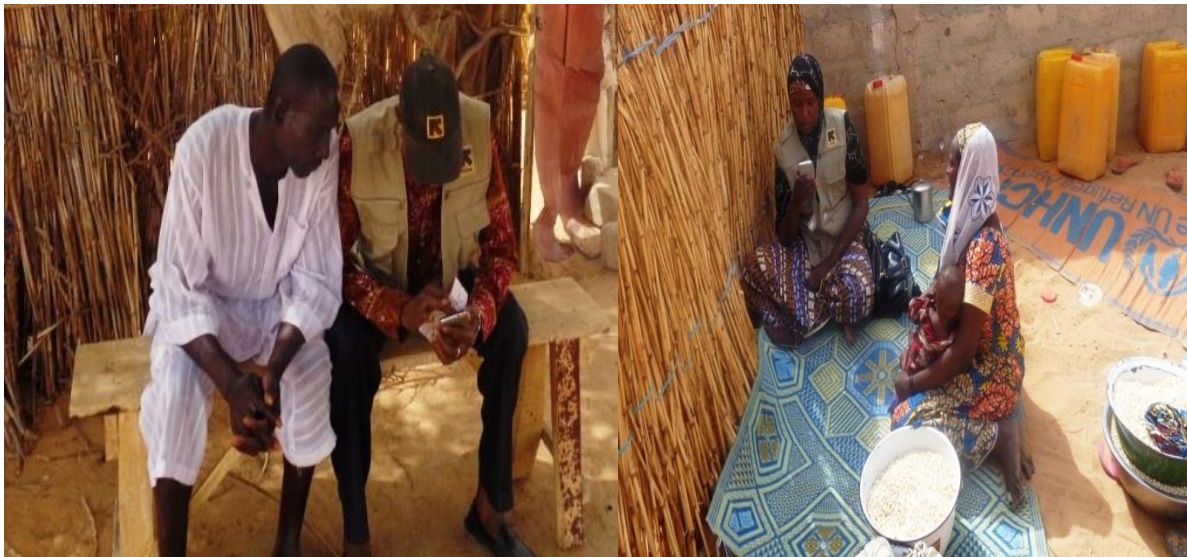
Enquête post distribution à Diffa.