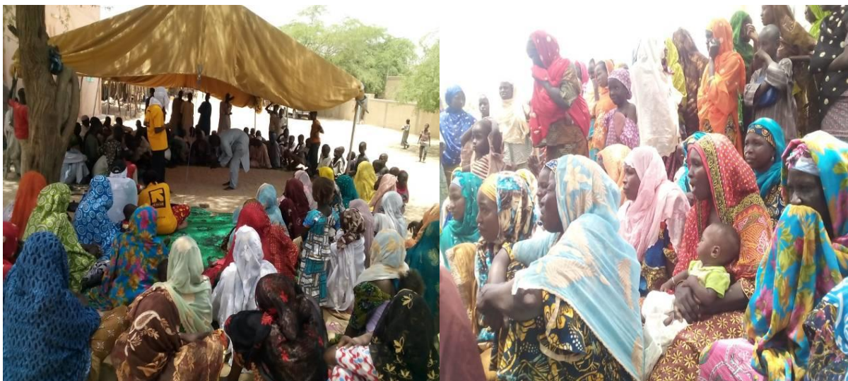
Activité de pré-déclenchement à Chétimari.