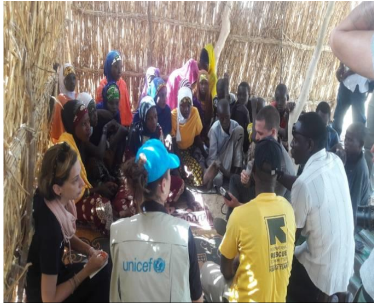
Entretien conjoint IRC/UNICEF à Assaga. Photo, IRC.