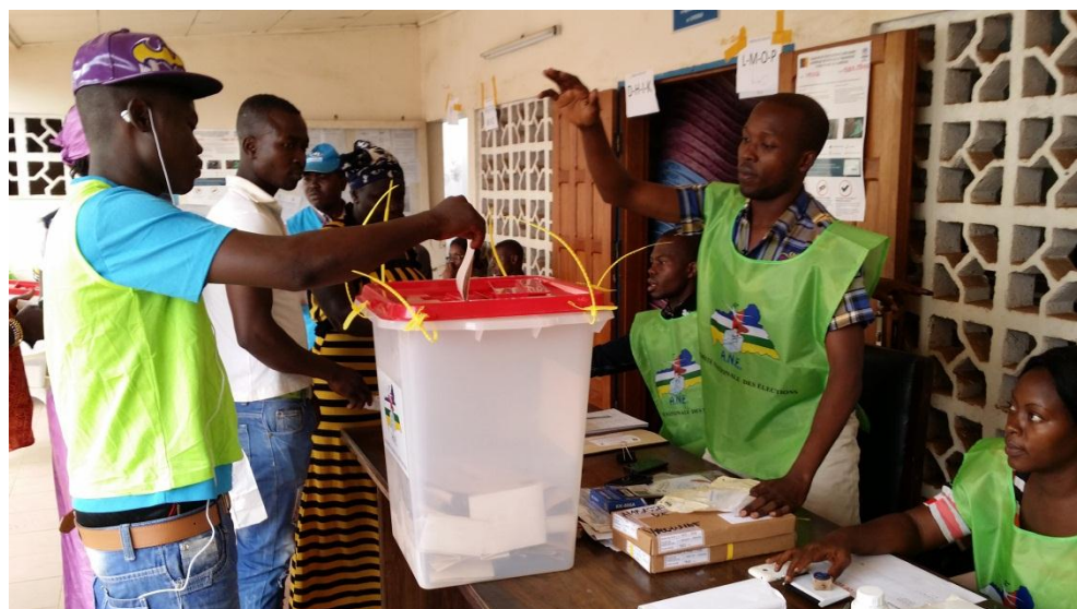
Les réfugiés centrafricains votant pour un nouveau Président et le retour de la paix dans leur pays.