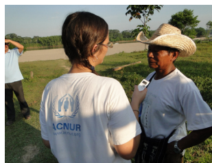
La emisión de radio semanal El Río permite a la población de frontera explicar sus preocupaciones.