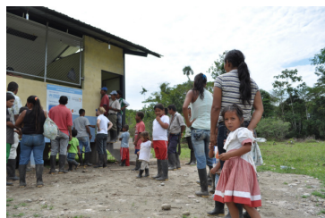
Nueva escuela en la comunidad de Villahermosa, Río San Miguel