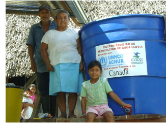
Instalación de sistema de agua segura en la comunidad de El Litoral, Río Putumayo.