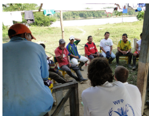
Socios y autoridades locales se unen a los diagnósticos participativos.