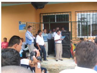
Inauguración de un sub-centro de salud en el río San Miguel.