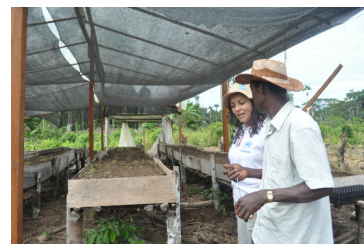
Las capacitaciones agrícolas en las comunidades de la frontera norte esperan mejorar la seguridad alimentaria y la producción.