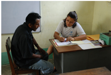
ACNUR ofrece asesoría legal en las comunidades fronterizas.