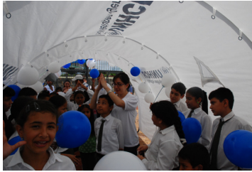
Celebración Día del Niño en Lago Agrio