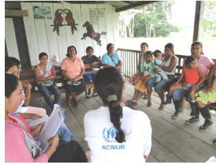
Diagnóstico participativo en una comunidad del Río Putumayo