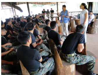
ACNUR ofrece capacitaciones a instituciones y diversos organismos en materia de refugio.