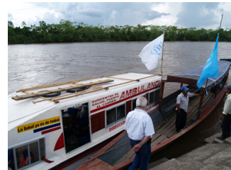
Una barcaza médica fluvial permite acceder a servicios médicos en zonas remotas.