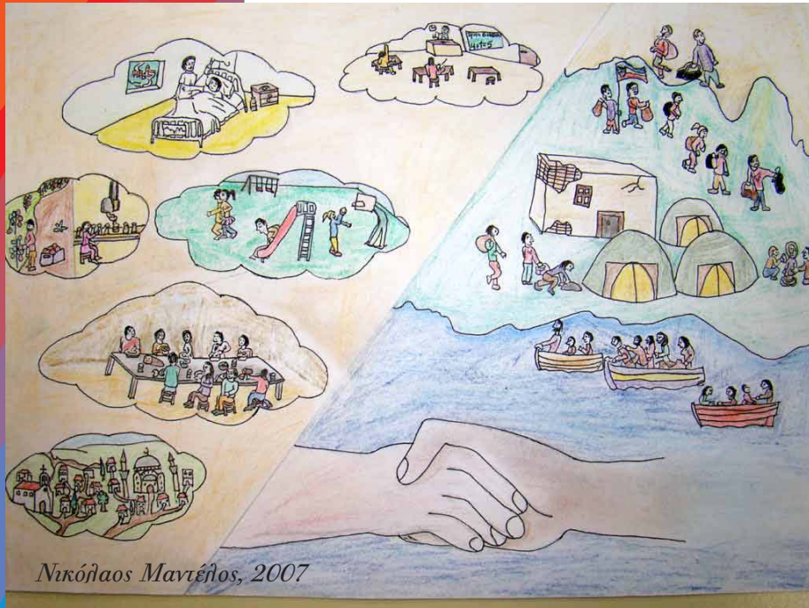
Νικόηαος Μανιέηος, 2007

Αντώνιος Μαγάλιος, 3ο Γεναίο Λύκειο Κομοτηνής, 2003