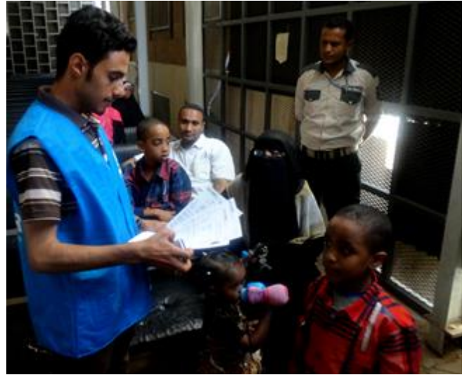
موظفو الخدمات المجتمعية التابعين للمفوضية يقدمون الاستشارات للأسر حول عملية التسجيل في صنعاء. المفوضة/أ. هادي.

وفقاً لليونيسف، أوقفت 87 في المئة من المدارس البالغ عددها 884 مدرسة في المحافظات الجنوبية الخمس (عدن وتعز ولحج والضالع وأبين) العمل؛ وقد تضررت 66 مدرسة وتستضيف 171 مدرسة النازحين داخلياً واحتل أطراف النزاع 51 مدرسة أخرى. وقد ذكرت منظمة الصحة العالمية أنه، بين 19 مارس/آذار و31 مايو/أيار، قُتل 2,288 شخصاً تقريباً نتيجة النزاع، كما أُصيب 9,755 شخصاً آخر. وتفيد المفوضية السامية للأمم المتحدة لحقوق الإنسان أن أكثر من نصف عدد القتلى (1,160 شخصاً) وأكثر من 2,800 شخص من الجرحى هم مدنيون. ووفقاً لمنظمة الصحة العالمية، لا يستطيع أكثر من 15 مليون شخص الوصول إلى الرعاية الصحية الأساسية. ويعاني أكثر من 12.5 مليون شخص من انعدام الأمن الغذائي. ومن بين هؤلاء، يعاني ستة ملايين شخص من انعدام خطير في الأمن الغذائي، أي بارتفاع بنسبة 17 في المئة في شهرين.