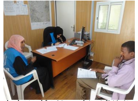
استئناف أنشطة التسجيل في مكتب المفوضية في صنعاء في هذا الأسبوع.