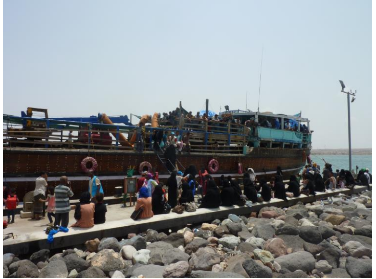
بعد رحلة استمرت 14 ساعة، وصل عدد من اليمينيين في 2 يونيو/حزيران إلى ميناء أوبوك في جيبوتي حيث قدّم لهم مكتب أونارس والمفوضية وبرنامج الأغذية العالمي والهلال الأحمر المياه والمواد الغذائية والمساعدة الطبية والاستشارات القانونية. المفوضية