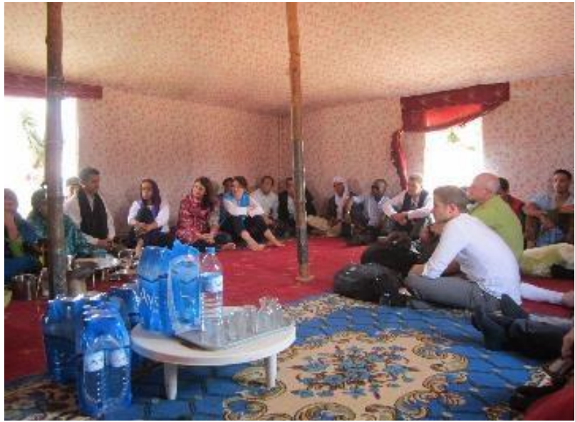
لقاء الجهات المانحة مع اللاجئين في مخيم الداخلة خلال البعثة المتعددة الجهات المانحة في مايو/أيار

تعرب المفوضية عن امتنانها للدعم المهم الذي قدمته الجهات المانحة التي ساهمت في تنفيذ العملية فضلاً عن الجهات التي ساهمت في برامج المفوضية من خلال تقديم الأموال غير المخصصة والمخصصة على نطاق واسع. والجهات المانحة للمساهمات غير المقيدة والإقليمية في عام 2015 هي: الولايات المتحدة الأمريكية (133 مليون) | السويد (80 مليون) | المملكة المتحدة (53 مليون) | هولندا (45 مليون) | النرويج (44 مليون) | الدانمارك (28 مليون) | أستراليا (24 مليون) | الجهات المانحة الإنسانية (22 مليون) | اليابان (18 مليون) | سويسرا (16 مليون) | فرنسا (14 مليون) | كندا (11 مليون) | ألمانيا (11 مليون)