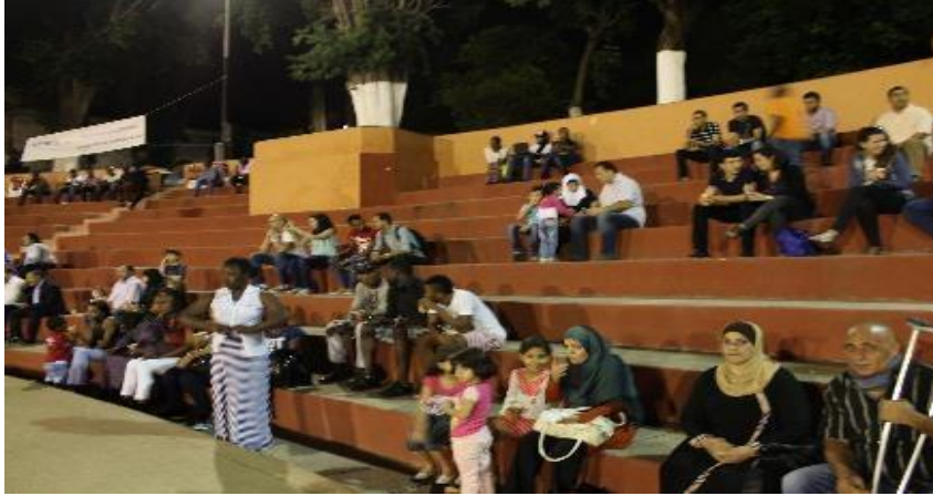
يوم اللاجئين العالمي في تندوف.