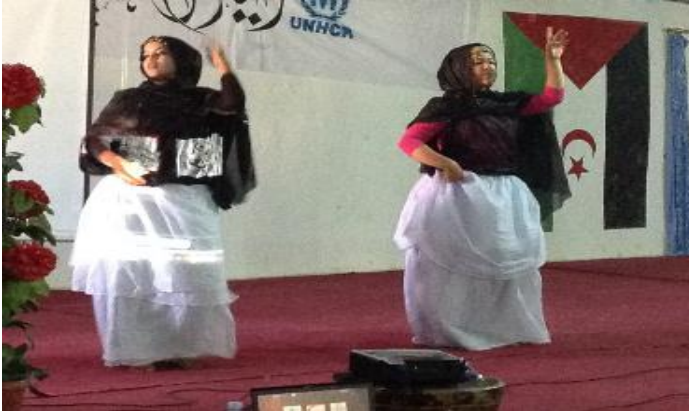
عروض ثقافية في يوم اللاجئ العالمي في مخيم سمارة.