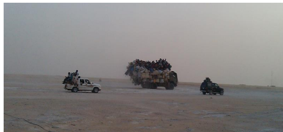
Camions et petits véhicules transportant des migrants sur l'axe Agadez - Dirkou.

R : Des migrants de tout genre et toute nationalité. En majorité ils proviennent d'Afrique de l'Ouest, d'Afrique centrale et vont en direction de la Libye ou de l'Europe via la Libye. On trouve aussi des migrants refoulés de la Libye mais aussi des Nigériens allant à Agadez suite à la décision du Gouvernement du Niger de fermer l'accès au gisement aurifère de Djado. On croise enfin des commerçants apportant des produits alimentaires et non alimentaires de la Libye vers la région d'Agadez