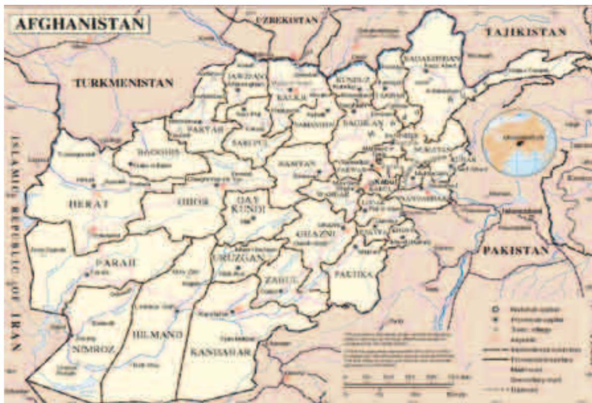
Abbildung 2: Provinzen in Afghanistan

Etwa 1992 begannen die bewaffneten Mudschaheddin-Gruppierungen, neue Koalitionen zu schmieden, die sich vornehmlich an Regionen und ethnischer Zugehörigkeit orientierten. Die Tadschiken und Usbeken im Norden, die Hazara in der Mitte und die Paschtunen im Osten und Süden schlossen sich während des Bürgerkriegs (1992-1996) zu konkurrierenden Gruppierungen zusammen. Sie standen vor einer neuen Herausforderung: dem Rückgang der Geldflüsse aus dem Ausland. Der Zerfall der Sowjetunion bedeutete das Ende der durch den Kalten Krieg bestimmten Interessen in Afghanistan. Nachdem der Konflikt seine Dschihad-Dimension verloren hatte, erlosch das Interesse Saudi-Arabiens an der Finanzierung der islamischen Mudschaheddin. Als wichtigste externe Geldgeber betätigten sich nur noch die UNO im humanitären Bereich und Pakistan (9) .