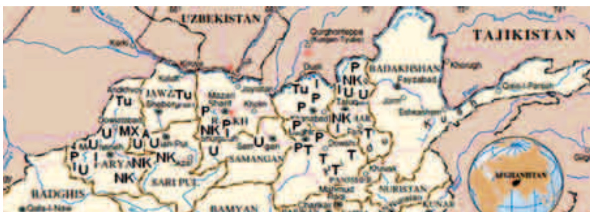
Abbildung 4: Ethnische Zusammensetzung bekannter Taliban-Fronten im Norden

Während des Informationsbesuchs der dänischen Einwanderungsbehörde in Afghanistan vom 25. Februar bis 4. März 2012 erklärte die Unabhängige Afghanische Menschenrechtskommission (AIHRC), dass die Taliban in nichtpaschtunischen Gebieten oft die Gemeinschaft auffordern, sich ihnen anzuschließen, oder in von Armut geprägten Gegenden Menschen Geld anbieten, damit sie für sie Aufgaben erledigen (170) . Eine Kontaktperson in Afghanistan wies darauf hin, dass bei der Rekrutierung von Angehörigen anderer Ethnien als der paschtunischen oft finanzielle Anreize entscheidend sind (171) . Auch religiöse Motive spielen als mobilisierender Faktor eine wichtige Rolle, wenn Aufständische versuchen, Beziehungen zu anderen Ethnien als den Paschtunen herzustellen (172) .