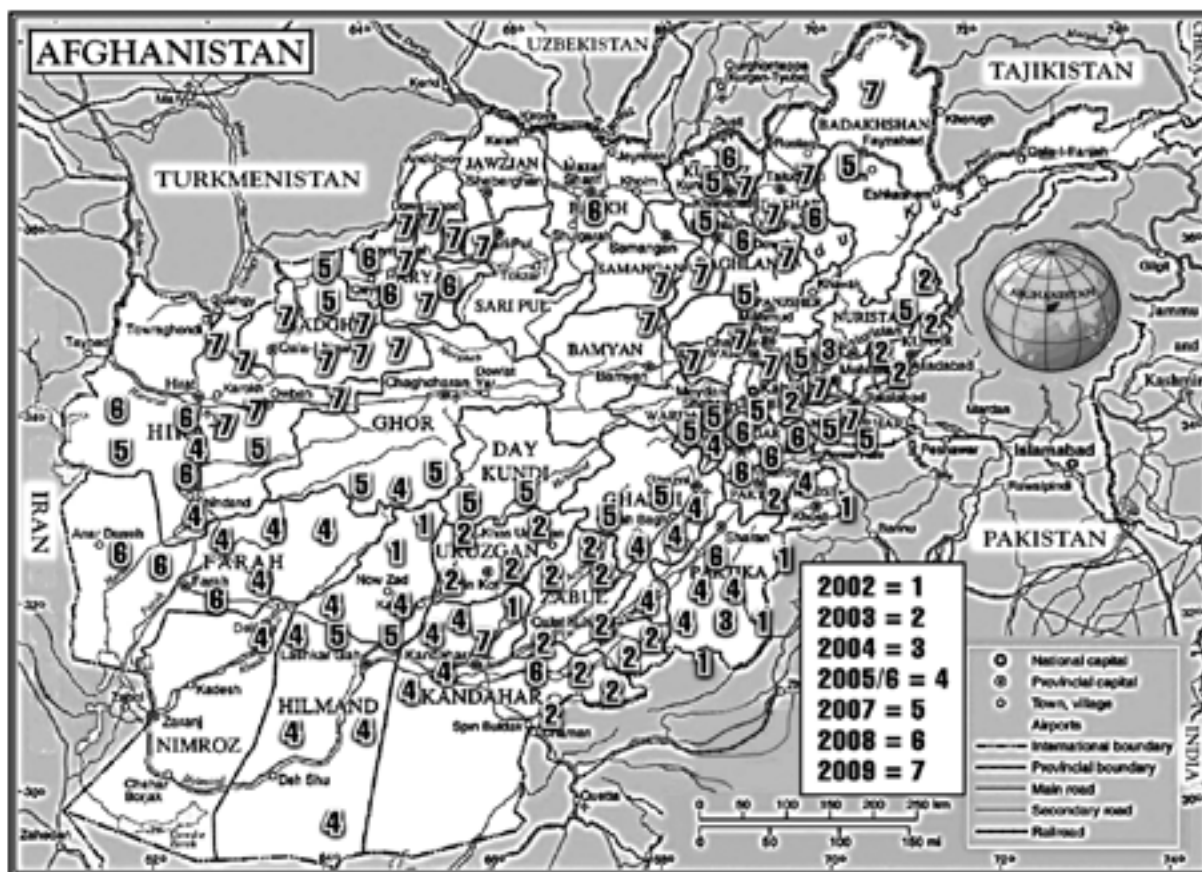
Abbildung 3: Die Ausweitung des Aufstands

Ein weiteres Schlüsseldatum in der Geschichte Afghanistans war der 11. September 2001. Die Ereignisse an diesem Tag veranlassten die USA zur Intervention in dem Land. Die CIA rüstete die bewaffneten Gruppierungen der Nordallianz aus. US-amerikanische Sondereinsatzkräfte unterstützten diese Gruppierungen und forderten gezielte Luftschläge an. Dank der Kombination aus Luftangriffen und Einsatz afghanischer Bodentruppen konnten die Taliban geschlagen werden. Im Dezember 2001 organisierten die Vereinten Nationen in Bonn eine Afghanistan-Konferenz, zu der mit Ausnahme der besiegten Taliban verschiedene afghanische Gruppierungen eingeladen wurden und die zur Bildung einer Interimsregierung mit dem Paschtunen Hamid Karsai an der Spitze führte (20) .