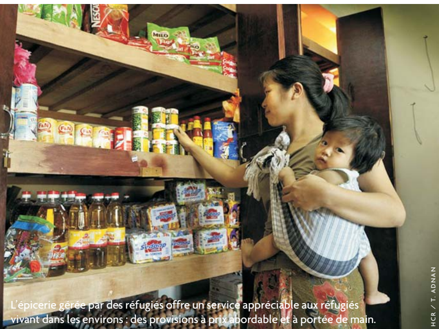
L'épicerie gérée par des réfugiés offre un service appréciable aux réfugiés vivant dans les environs : des provisions à prix abordable et à portée de main.