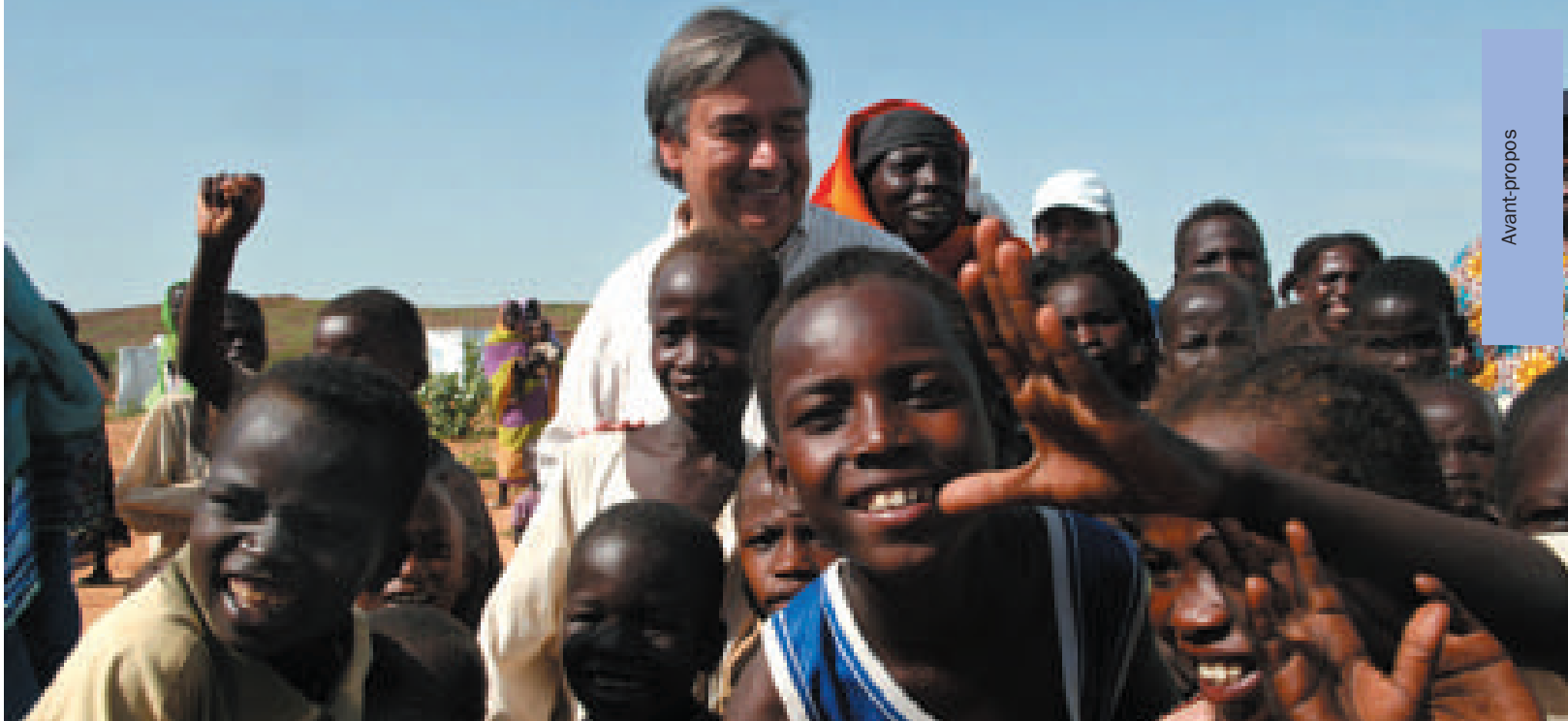
Soudan : le Haut Commissaire António Guterres avec des enfants déplacés au camp de Riyad, situé au Darfour occidental.

En 2006, l'une des priorités consistera à préserver la stabilité financière à laquelle l'Organisation est parvenue au cours des dernières années. Les financements prévisibles ont une importance cruciale à cet égard, puisqu'ils évitent les mesures de programmation prises en fin d'année, qui ont invariablement et directement des effets négatifs sur les populations dont nous nous occupons. Le Budget annuel de 2006 est plus conséquent que celui de 2005, principalement en raison de l'intégration des programmes spéciaux au Burundi et au Tchad. Néanmoins, nous avons fait preuve et nous continuerons de faire preuve de rigueur dans la hiérarchisation des activités et dans la limitation des dépenses.