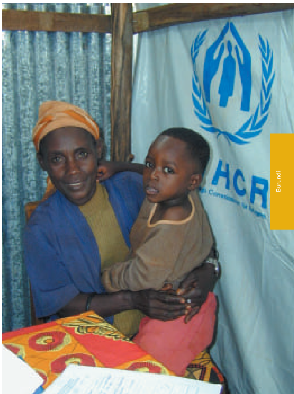
Une mère rapatriée et son fils, tout juste rentrés de Tanzanie, attendent d'accomplir les formalités d'enregistrement au centre d'accueil de Gisuru.

L'Organisation continuera de prodiguer une assistance aux communautés locales, de façon à accroître la capacité d'absorption des régions de retour et à promouvoir le dialogue entre les rapatriés et les populations d'accueil. Comme convenu avec