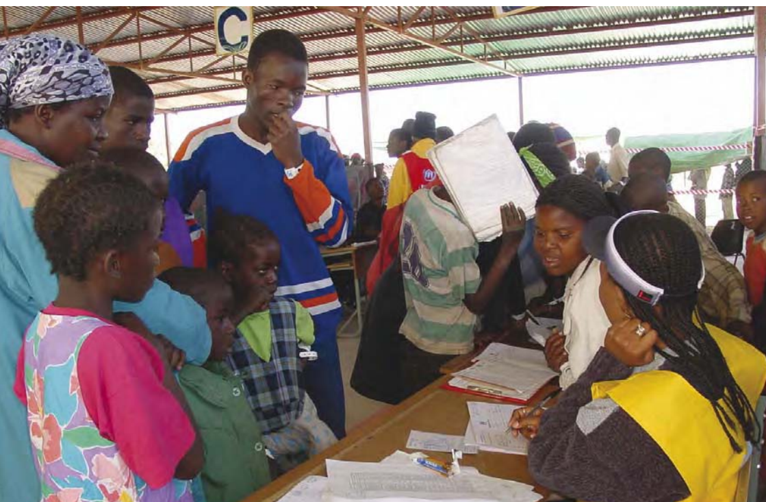
Une famille de réfugiés angolais se fait enregistrer dans le camp d'Osire en Namibie.