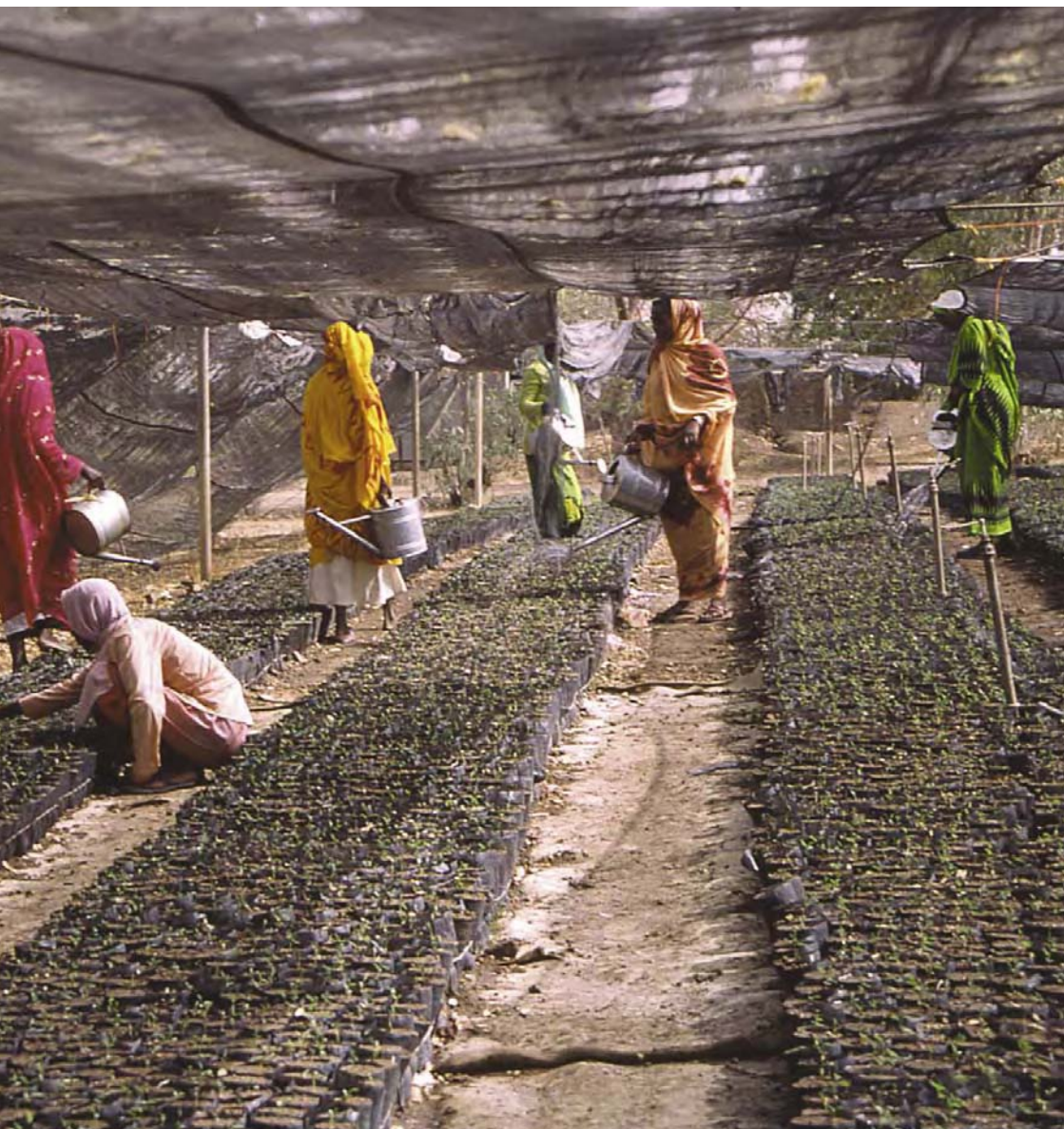
Des réfugiés d'Erythrée plantent des semis dans la pépinière collective des camps de Showak, au Soudan.