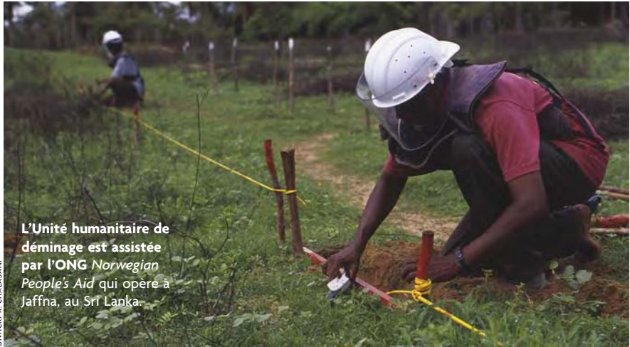
L'Unité humanitaire de déminage est assistée par l'ONG Norwegian People's Aid qui opère à Jaffna, au Sri Lanka.

L'objectif final du partenariat est d'utiliser au mieux les ressources disponibles pour assister et protéger les réfugiés ainsi que les autres bénéficiaires. Les partenariats UNHCR/ONG sont donc régis par deux considérations essentielles : les résultats obtenus et le rapport coût-efficacité des opérations.